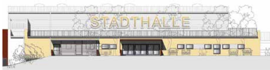
Planansicht der zukünftigen Sporthalle Zwettl

Weiters erhalten alle Besucherinnen und Besucher der Spatenstichfeier eine kostenlose Eintrittskarte für das am gleichen Tag stattfindende Bundesligamatch „Union Volleyball Raiffeisen Waldviertel vs. Hypo Tirol“, das ab 19.00 Uhr in der Sporthalle für Spannung sorgen wird.