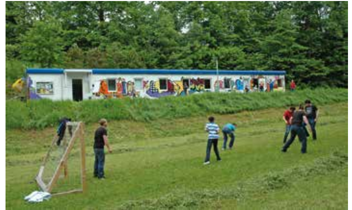
Für den Jugendkulturtreff JUZZ in der Hauensteinerstraße ist eine Überdachung geplant.

Die erforderlichen Zimmermanns- und Spenglerarbeiten werden von regionalen Anbietern ausgeführt, in Summe werden rund 21.100,- Euro in diese Maßnahme investiert.