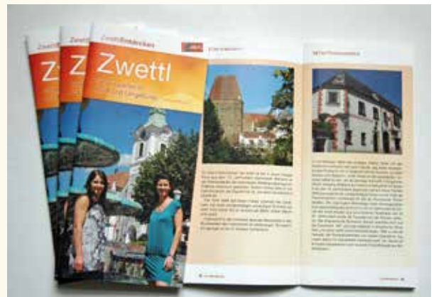
Titel- und Musterseite der überarbeiteten Neuauflage der Broschüre „Zwettl entdecken“

Die Broschüre „Zwettl entdecken“ ist kostenlos bei der Tourist-Info im Alten Rathaus sowie im Stadttamt Zwettl erhältlich.