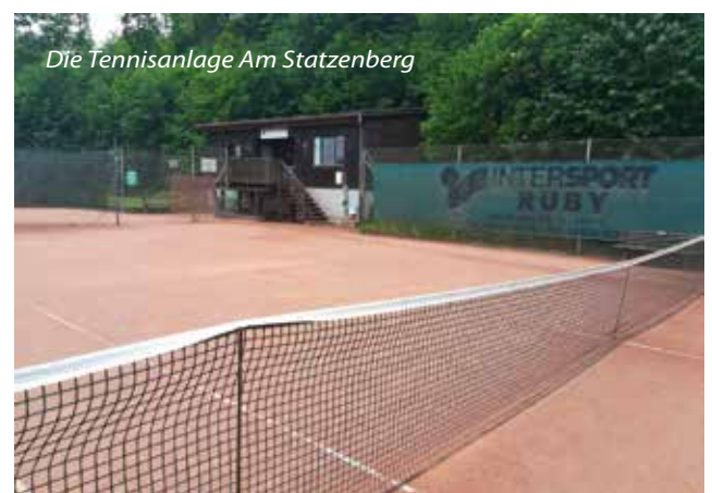
Die Tennisanlage Am Statzenberg