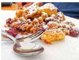
Eine süße Gaumenfreude: der Kirschscharren