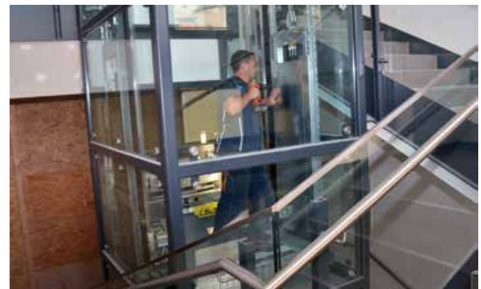
Letzte Handgriffe: Der Einbau der Liftanlage ist abgeschlossen. (Aufnahmedatum: 5. Juni)