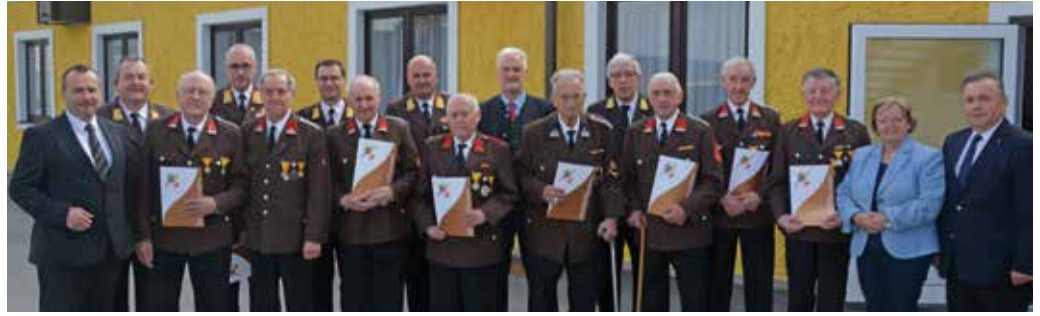
Für 60 bzw. 70 Jahre verdienstvolle Tätigkeit ausgezeichnet: Die geehrten Feuerwehrmänner mit den Ehrengästen

Anlässlich des Abschnittsfeuerwehrtages des Feuerwehrabschnittes Zwettl, der am 8. April in Schweiggers stattfand, wurde einerseits Bilanz für das Jahr 2017 gezogen und andererseits wurden verdiente Feuerwehrmitglieder ausgezeichnet.