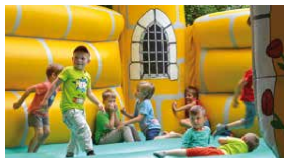
Hüpfburg für die Kleinsten