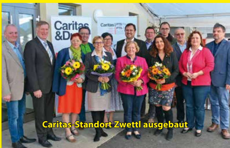
Caritas-Standort Zwettl ausgebaut