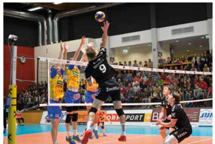
Momentaufnahme aus dem Volleyball-Finalspiel in Zwettl

Die Volleyballer schafften mit dem 2. Platz in der Bundesliga erneut die Qualifikation für einen internationalen Startplatz (Europacup und MEVZA), sodass sie im Herbst wieder auf internationalem Parkett spielen werden. Dabei sind auch spannende Heimspiele in der Stadthalle Zwettl zu erwarten.