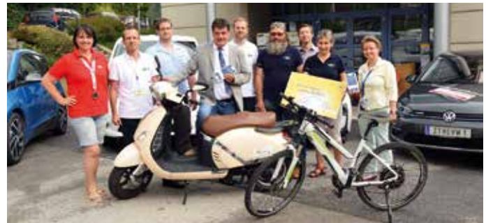
Elektromobilität wurde kostenfrei getestet