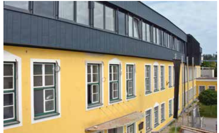
Das neue 2. Obergeschoß nach dem Gerüstabbau (Aufnahmedatum: 19. Juni)

Der Zugang erfolgt grundsätzlich weiterhin über den Haupteingang. In der Zeit von 6. August bis 9. September 2018 ist dieser jedoch gesperrt und der Eingang erfolgt von der Rückseite des Stadtamtes. Bitte beachten Sie die Beschilderungen.