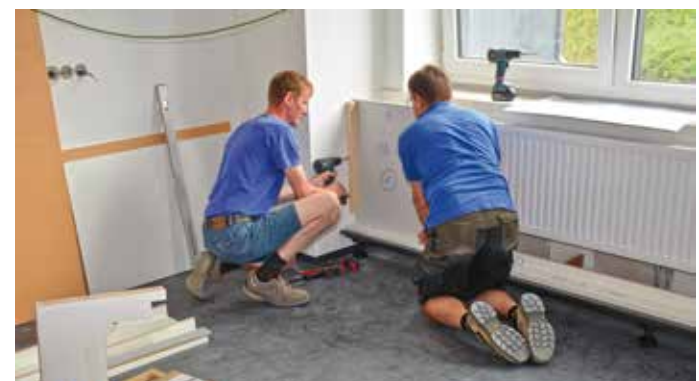
Die Tischler leisten bereits Vorarbeiten, damit die Büromöbel geliefert und montiert werden können. (Aufnahmedatum: 14. Juni)