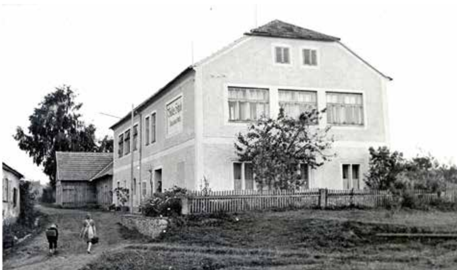
Volksschule Jagenbach, ca. 1940