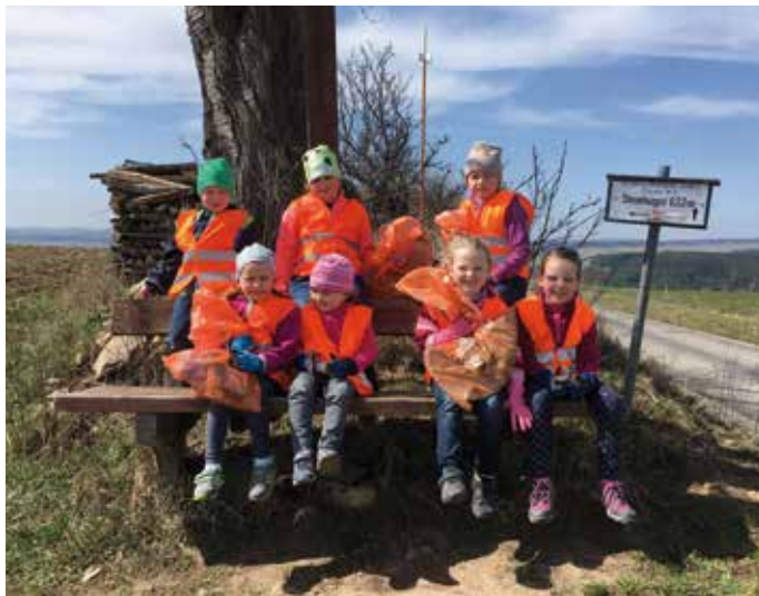
Schon die jüngsten Moidramser waren mit Feuereifer bei der ihnen anvertrauten Aufgabe dabei.