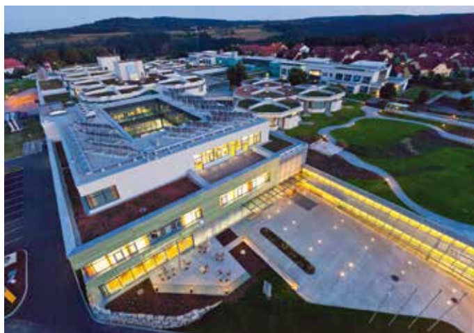
Das moderne Landeskrankenhaus bietet 700 Mitarbeitern Beschäftigung und genießt für Spitzenleistungen auch einen Spitzenruf.

Miedler sieht seiner Aufgabe mit Freude entgegen: „Mir ist es ein Anliegen, die Abteilung nachhaltig und ohne Einschränkungen weiterzuführen sowie auf Auszubildende aus der Region zu setzen.“