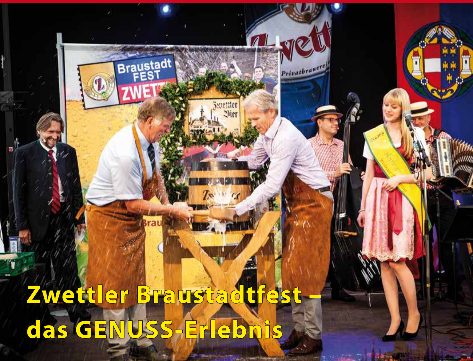
Zwettler Braustadtfest – das GENUSS-Erlebnis

Postentgelt bar entrichtet - An einen Haushalt, Amtliche Mitteilung