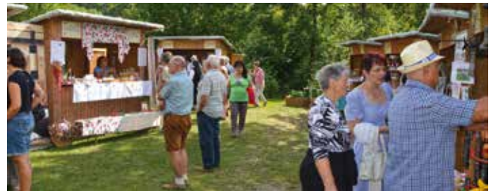
Schmankerlmarkt lockte mit selbstgemachten Produkten