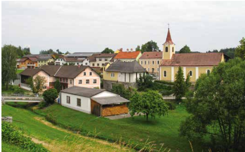
Eine aktuelle Ansicht von Jagenbach (Aufnahmedatum 20. Juni 2018) zeigt die Veränderungen der letzten 60 Jahre.

Die westlichste der Zwettler Katastralgemeinden zeichnet sich durch eine besonders aktive Ortsgemeinschaft aus. Es beginnt bei den Jüngsten. Jagenbach erhielt als erste der Zwettler Katastralgemeinden bereits 1973 einen Landeskindergarten. Erziehungsschwerpunkt ist hier u.a. das Feiern von Festen in der Gemeinschaft wie etwa das Martinsfest, Nikolaus und Ostern. In der Volksschule