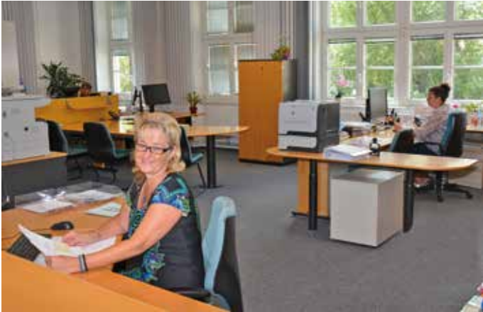
Das fertige Kulturbüro wird provisorisch von Amtsleitung/Sekretariat, sodann bis Mitte 2019 von der Finanzabteilung genutzt. (Aufnahmedatum: 19. Juni)