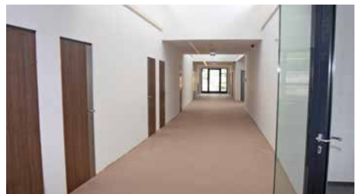
Das 2. Obergeschoß vor der Fertigstellung: Nur Feinarbeiten und die Büromöbel fehlen noch. (Aufnahmedatum: 5. Juni)