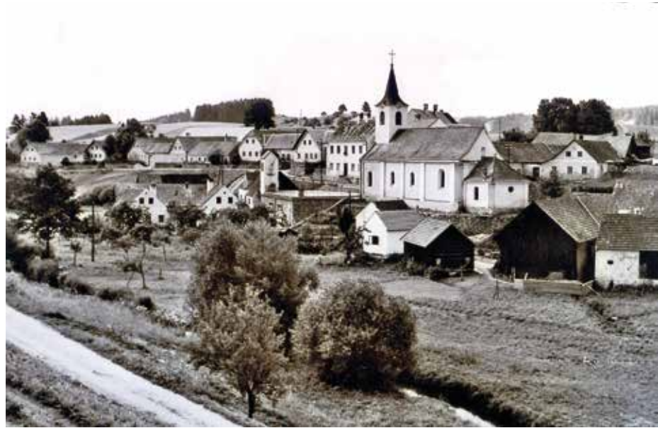
Ortsansicht von Jagenbach, ca. 1960er Jahre

1851 errichteten die Jagenbacher das Pfarrhaus, ein Jahr später ihr Schulge-