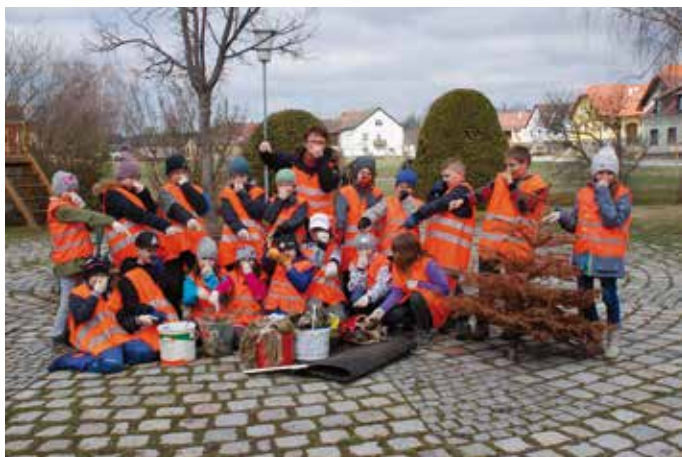
Vorbildfunktion: Auch zahlreiche Schulen halfen mit, wie die Volksschule Jagenbach.