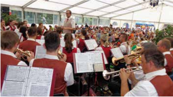
Die Musiker des Musikvereins C.M. Ziehrer im voll besetzten Festzelt