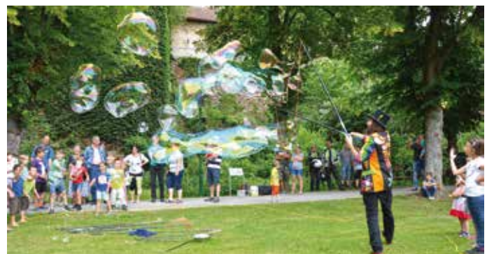
Riesenseifenblasen als Attraktion des Tages