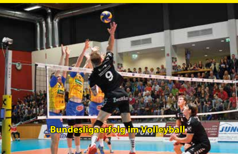
Bundesligaerfolg im Volleyball