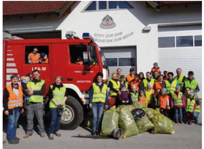
In Gerotten engagierten sich die Freiwillige Feuerwehr und die Dorfgemeinschaft für eine saubere Umwelt.

Die zuständigen Stadträte Erich Stern und Gerald Knödlstorfer sowie Umweltgemeinderat DI Bernhard Thaler danken allen Helfern für ihre Teilnahme. Die folgenden Bilder stehen stellvertretend für die zahlreichen unterstützenden Organisationen. Alle uns zur Verfügung gestellten Fotos wurden auf www.zwettl.gv.at zu einer Bildergalerie zusammengestellt.