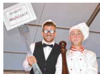
Comedy-Kellner im Festzelt unterwegs