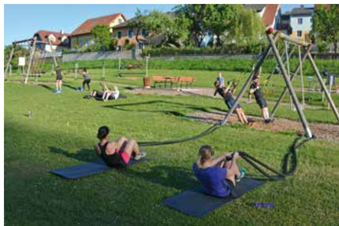
Der Bewegungspark bietet viele sportliche Outdoor-Möglichkeiten.