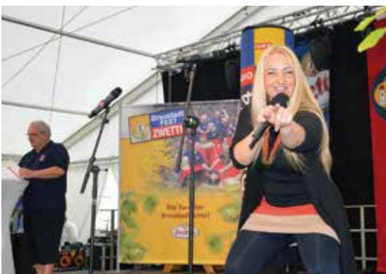
ORF-Sendung Radio 4/4: Styrina heizte den Besuchern so richtig ein