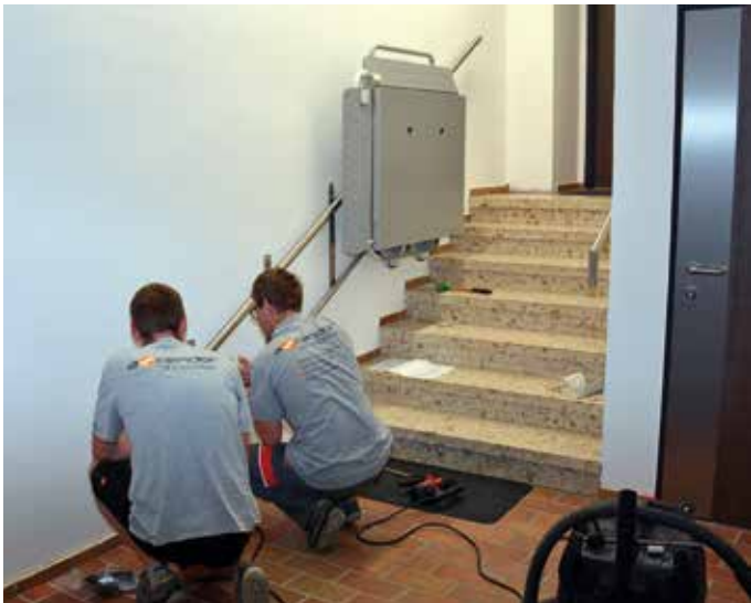
Barrierefrei in das Kulturbüro (Aufnahmedatum: 22. Mai)