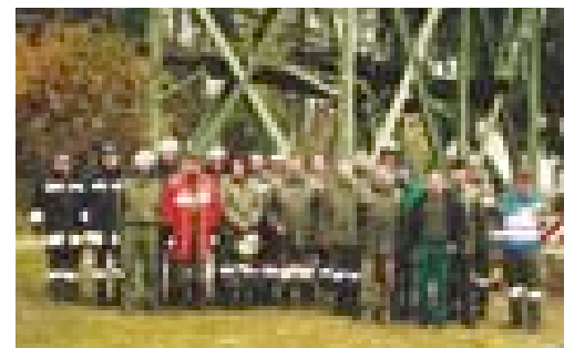
Das Montageteam nach getaner Arbeit.

Gesamtkosten: € 12.581,- Förderung Stadterneuerung: € 6.100,- Planung: Gemeinde (Bauamt) Bau- und Aufstellungszeit: November 2001